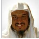
الشيخ سليمان الجبيلان