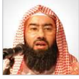
الشيخ نبيل العوضي