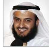
الشيخ مشاري العفاسي