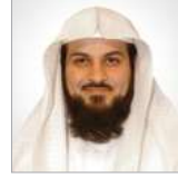
د. محمد العريفي