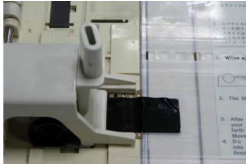
5 -ارفع ماسك علبة الفلم